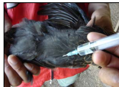
การฉีดเข้ากล้ามเนื้อหรือใต้ผิวหนัง