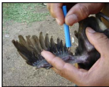
การแทงหนังปีกเพื่อปลูกฝี